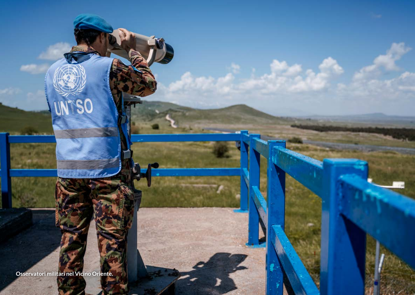
Osservatori militari nel Vicino Oriente.