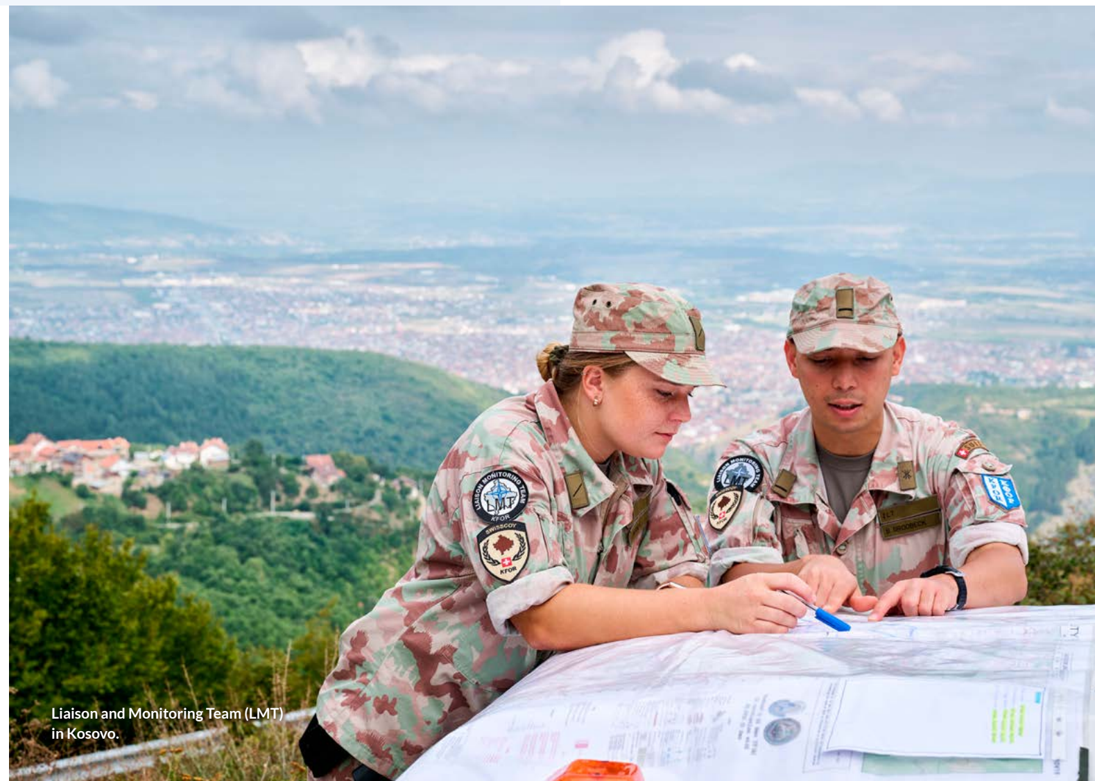
Liaison and Monitoring Team (LMT) in Kosovo.